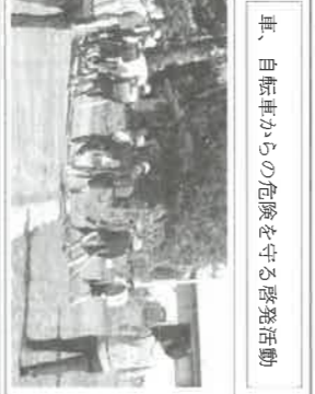
車、自転車からの危険を守る啓発活動