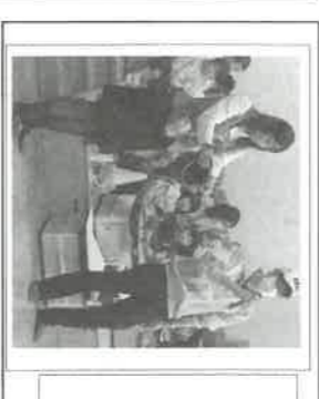
一旦停止 歩行者優先