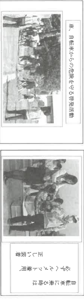
自転車に乗る時は必ずヘルメット着用、正しい装着