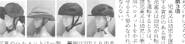
写真のヘルメットは一例