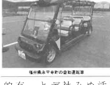
福井県永平寺町の自動運転車