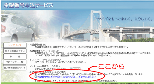
『希望番号申込書作成ツールをダウンロードする』 (Version1.0.1)