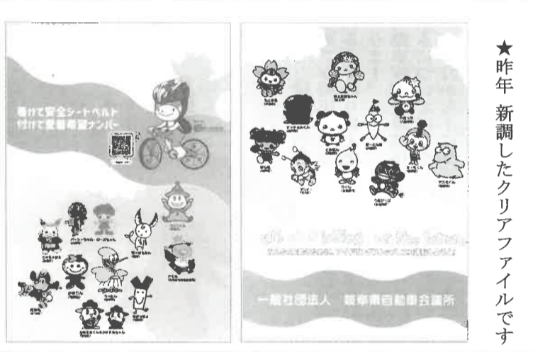
★昨年新調したクリアファイルです