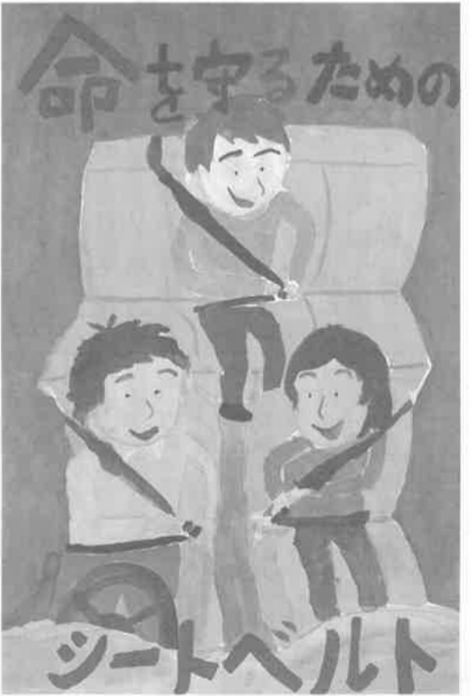
命を守るためのシートベルト着用強調月間. Advertisement for the seat belt and child seat usage campaign.