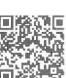
《詳細はコチラから》

国土交通省では、防災に役立つ様々な情報を、より便利に、より簡単に活用できるように、ハザードマップポータルサイトを運営している。